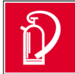
Kennzeichnung für Feuerlöscher