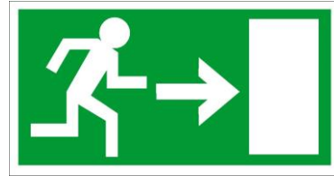
Fluchtweg nach rechts