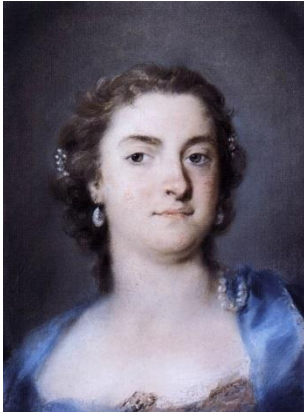
Faustina Bordoni ©Rosalba Carriera, ca 1730

Der Streit zwischen Cuzzoni und Bordoni Konzert des Barockorchesters der MUK