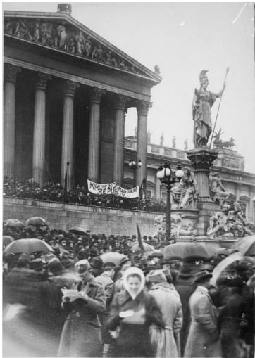
Ausrufung der Republik Deutsch-Österreich am 12. November 1918 vor dem Parlament

Die Jahre 1918 und 1938 stellten in der Geschichte Österreichs bedeutende Zäsuren dar, die auf KünstlerInnen dieser Zeit unmittelbaren Einfluss nahmen. Doch auch widrigste Umstände wie Krieg, Flucht oder Vertreibung vermochten die Schaffenskraft vieler Kreativer nicht zu brechen. Einige traten mit ihren künstlerischen Werken den Veränderungen entgegen. Andere hingegen trachteten danach, sich und ihre Kunst den Umständen anzupassen, oder – davon scheinbar unberührt – die Arbeit einfach fortsetzen zu können.