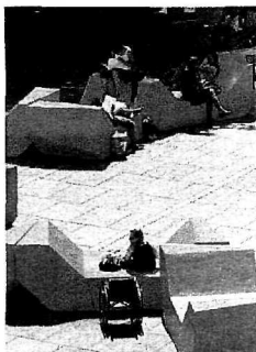
Heute werden die ersten pinken Enzis geliefert.

Kickoff-Party. Die offizielle Eröffnung ist um 21.15 Uhr auf der Bühne im Haupthof. Danach wird eine Musik- und Tanzperformance geboten. Und zum Abschluss des Abends gibt es ab 22 Uhr eine Jazz-Lounge in der Arena 21 sowie eine Kickoff-Party im Café Leopold. (tok)