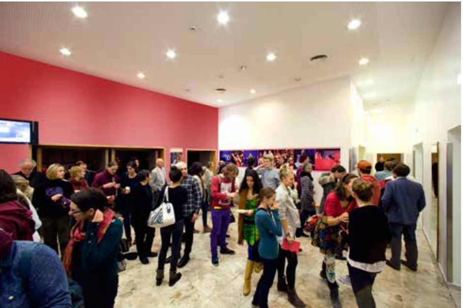
MUK.theater Johannesgasse 4a, 1010 Wien