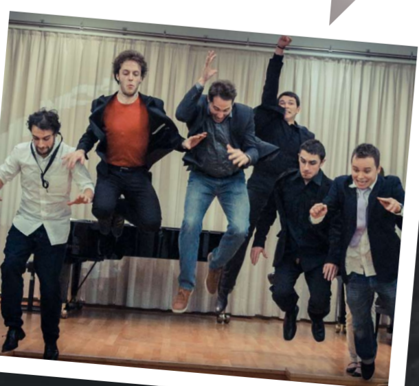
Saxophonklasse Lars Mlekusch